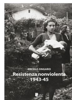
Ercole Ongaro Ed. I libri di Emil, Bologna, 2013

(Brescia), vive a Lodi; è direttore dell'Istituto lodigiano per la storia della Resistenza e dell'età contemporanea (Ilseco). Ha pubblicato, a partire dal 1977, saggi e monografie su protagonisti, istituzioni, momenti di storia politica e sociale dell'Ottocento e del Novecento. Ha coordinato il Comitato per la pace del Lodigiano dal 1990 al 1999 e il Comitato Lodigiano per l'acqua pubblica dal 2007.