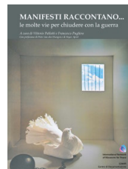
A cura di Vittorio Pallotti e Francesco Pugliese Ed. Grafiche Futura, Trento, 2014

"Nonostante i social media e altre innovazioni nel mondo delle comunicazioni, l'umile manifesto continua a rivestire una funzione essenziale, che questo libro straordinario celebra degnamente."