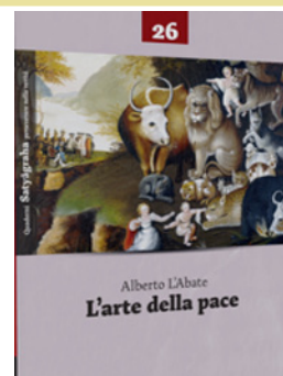
Alberto L'Abate Quaderni Satyagraha n.26 Gandhi Edizioni, Pisa, 2014

come stella polare per quanti pensino che sia necessario costruire istituzioni internazionali alternative agli eserciti nella gestione delle situazioni di crisi e nel promuovere la riconciliazione e la pace. (dal sito " http://www.gandhiedizioni.com ")