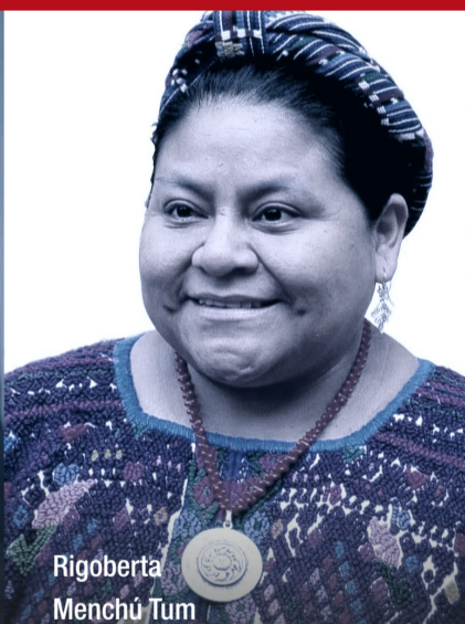
Rigoberta Menchú Tum